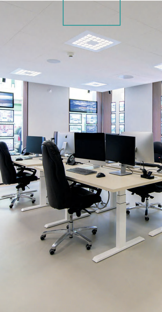
DOPPO AMBIENTE BODEN, IBOD-10