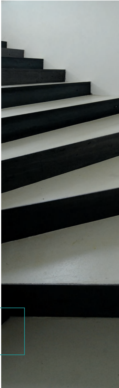
DOPPO AMBIENTE BODEN, IBOD-02