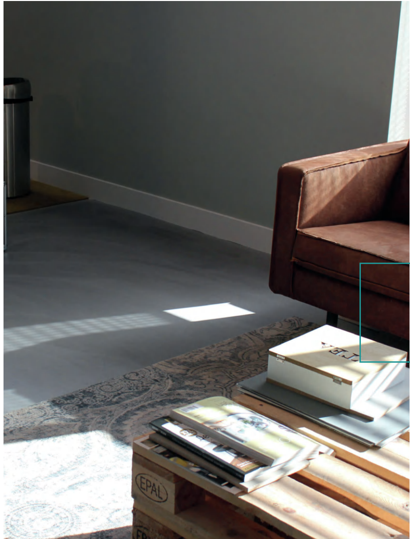
DOPPO AMBIENTE BODEN SOLIDO, NR. 58