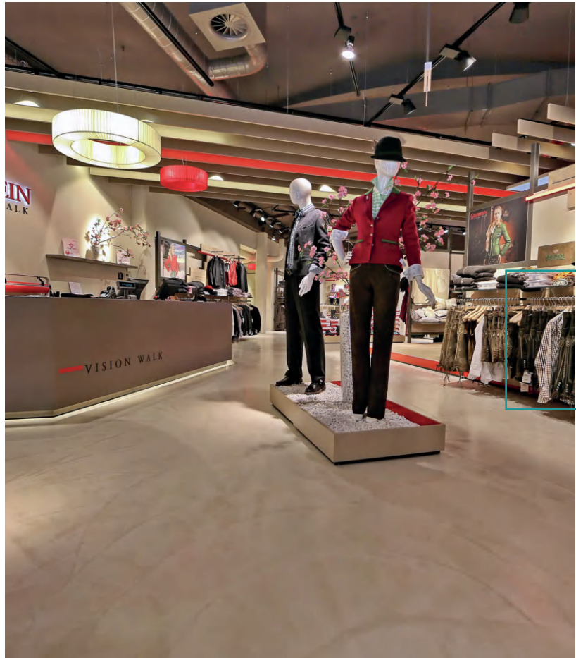
DOPPO AMBIENTE BODEN SOLDO, NR. 58