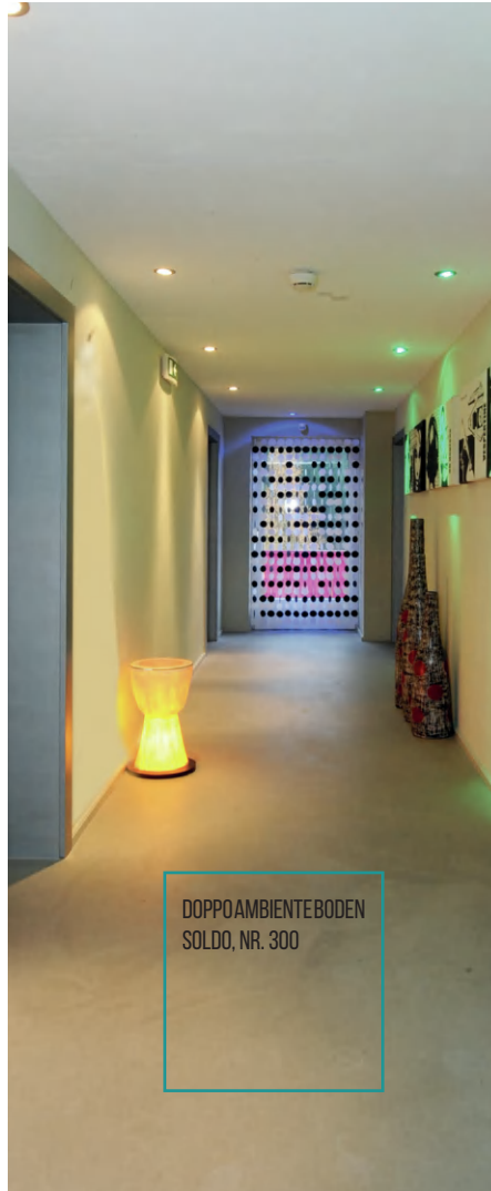
DOPPOAMBIENTE BODEN SOLDO, NR. 300