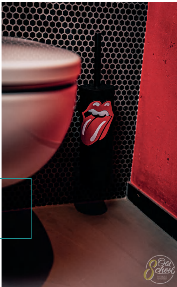
AMBIENTE, PRO+, IBOD-16