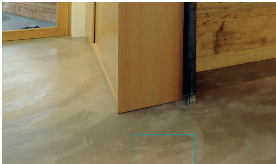
DOPPOAMBIENTE BODEN SOLDO, IBOD-15